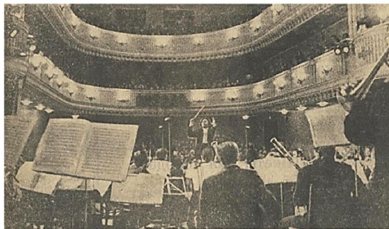
Состоялся первый концерт Красноярского симфонического оркестра. Репортаж с этого события публикуется на четвертой полосе.